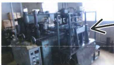
手前にセットされたステン板を、