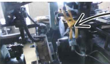
2本のアームがグイッと動いて