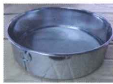
←出来上がる製品は、【ふるい/うらごし】です。

さて、その大きな工場の中でも我々が気になったのは、この製造機のラインです。これは写真右手前にセットした材料板を自動で奥へ奥へそして左側へ左側へと流しながら自動で加工をして、少しだけ人の手で補助するだけで製品を完成させる機械です。導入から35年を経て今なお現役バリバリの頼りになるオジサマです（オバサマかも）。その見事な働きっぷりを何とかお伝えできたらいいな、と思います。