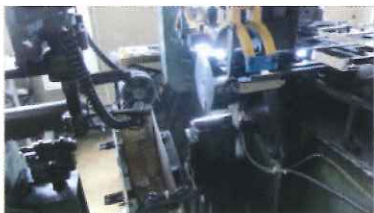
流れてきたステン板を丸めます