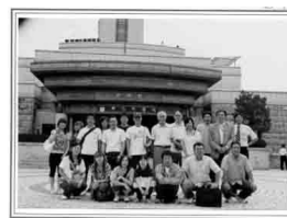
今年7月の社員旅行写真