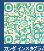
カンダ インスタグラム