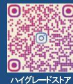
ハイグレードストア